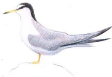
Morwennol Fechan // Little Tern ( Sterna albifrons )

Cemlyn is sometimes visited by other tern species, so have a good look - there may be something rare on the islands.