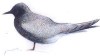
Corswennol Ddu // Black Tern ( Chlidonias niger )